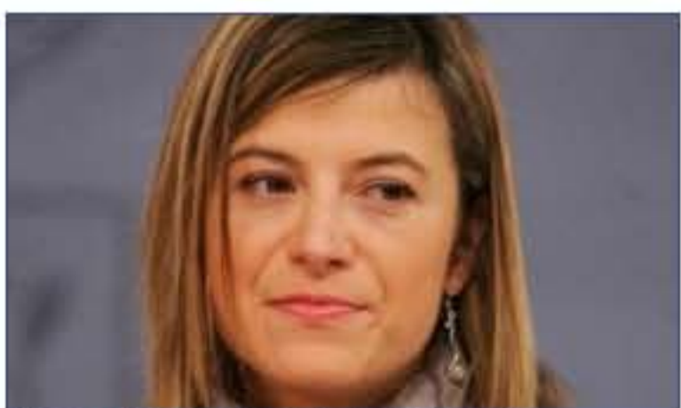
Bibiana Aído, ministra de Igualdad

La igualdad en los consejos de administración pretendida por Aído no llega. Y para que llegue, como cuenta en su edición de este martes el diario ABC, la ministra de Igualdad quiere llevar a cabo una iniciativa singular: ha elaborado una lista de 80 mujeres que ella considera capacitadas para desempeñar cargos de responsabilidad en las sociedades mercantiles obligadas a presentar cuentas de pérdidas y ganancias.