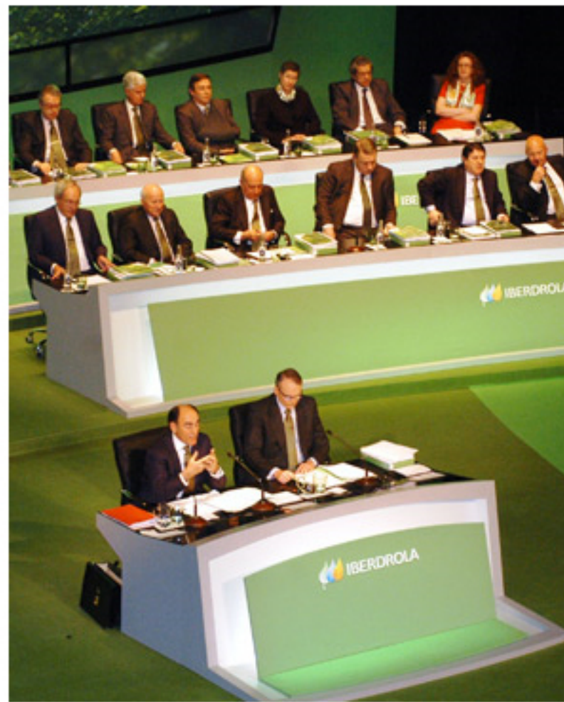
↑ Muchos hombres y muy pocas mujeres en el Consejo de Administración de Iberdrola.

En su número del sábado 20 de marzo, YO DONA analiza la situación desde todos los ángulos e investiga, con entrevistas con varias consejeras, por qué está aumentando tan lentamente la presencia femenina en el 'sancta sanctorum' de las empresas españolas.