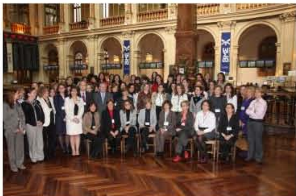
Foto: Presentación de los objetivos 15 en la Bolsa Española con la presencia de la ministra de Igualdad, Bibiana Aído