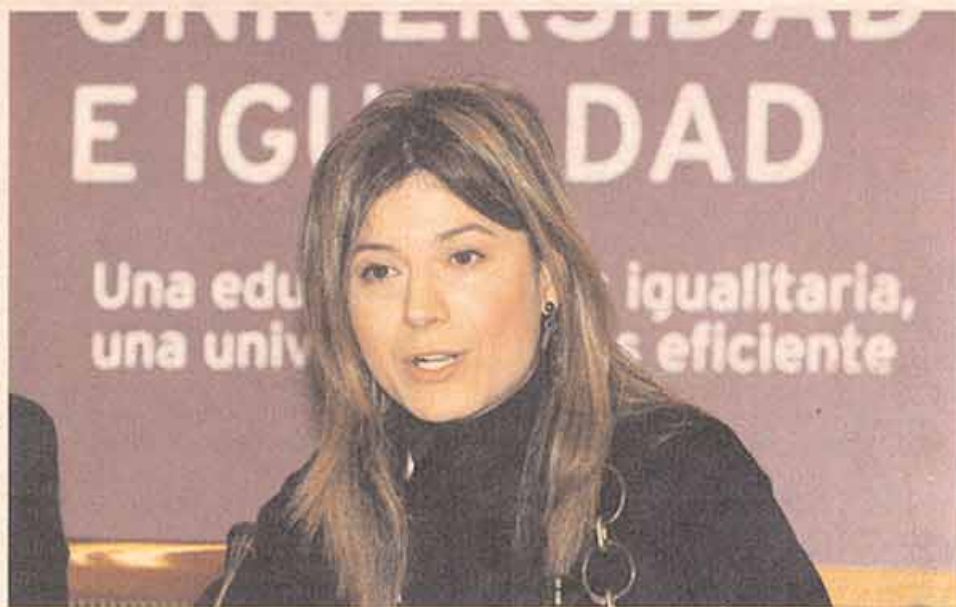
Bibiana Aído, ministra de Igualdad.

Ante estos resultados, la ministra admitió ayer que quedan por delante "sensibles" mejoras para lograr una "igualdad real" real entre los miembros de las plantillas, y por eso ha ideado un motor que pretende estar a la altura de la avería. Se trata del plan Objetivo 15 . Por el equilibrio en los consejos de Administración, un programa para im-