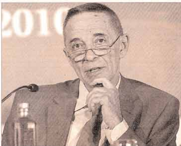
Julio Segura, presidente de la CNMV.

El regulador considera que estos datos reflejan la existencia de "algún tipo de sesgo sistemático -ya sea explícito o implícito- en los procesos de selección". Añade que el número reducido de mujeres en los órganos de gobierno de las compañías españolas se debe en gran medida a que, a pesar de los avances, persiste aún un déficit de mujeres con la ex-